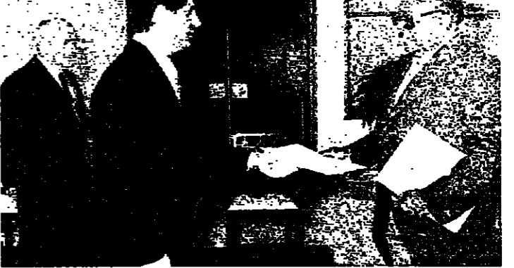
الجميل يتسلم أوراق اعتماد سفراء الفلبين

تسلم رئيس الجمهورية الشيخ امين الجميل قبل ظهر امس اوراق اعتماد كل من سفراء كولومبيا، الغابون، واندونيسيا بحضور رئيس الحكومة وزير الخارجية السيد رشيد كرامي وكبار موظفي البروتوكول في القصر الجمهوري.